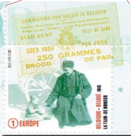
▲ Timbre extrait du feuillet

"1915, La Grande Guerre - A l'arrière du front..."