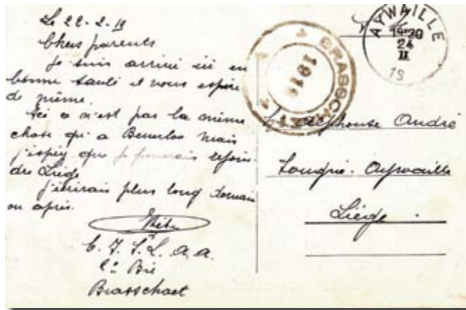
Carte vue de BRASSCHAET KAMP (du 22.3.1919) en franchise de port "SM" avec cachet double cercle en caoutchouc "BRASSCHAET / 1 ▼ 1 / 1919" vers "AYWAILLE 24.II.19" ▶