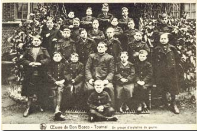
▲ C.P. photo éditée par J. MESSIAEN de TOURNAI. N'a pas voyagé. Texte imprimé côté recto : Œuvre de Don Bosco – Tournai "Un groupe d'orphelins de guerre"