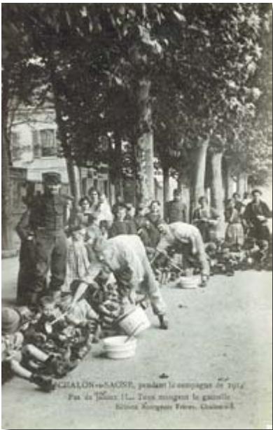
▲ C.P. photo éditée en France et expédiée depuis Chalons-saône. Texte écrit côté recto : "CHALON-s-SAONE, pendant la campagne de 1914. Pas de jaloux !!!... Tous mangent la gamelle."

Pendant la période de la Grande Guerre, l'alimentation des enfants constitue une grande préoccupation pour tous. Et comme montré à la page précédente, dès le début des hostilités, de nombreuses cartes postales présentent des soldats français ou allemands qui partagent leurs repas avec des enfants démunis ou proches de leurs lieux de cantonnement.