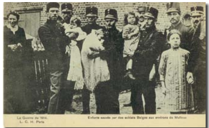
▲ C.P. photo éditée en France (L.C.H. Paris). N'a pas voyagé. Texte imprimé au recto : La Guerre de 1914 - L.C.H. Paris "Enfants sauvés par des soldats belges aux environs de Malines."

Pour les enfants ayant perdu leur père au combat ou toute leur famille dans les localités dévastées par les obus, on créera des institutions dans lesquelles ces orphelins vivront en communauté. Le but de celles-ci sera de former les enfants afin qu'ils puissent trouver un emploi une fois majeurs. Certains orphelins seront également adoptés par de la famille éloignée.