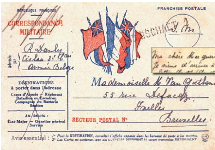
◀ Carte de correspondance pour militaires illustrée, en franchise postale "S M", de BRASSCHAET KAMP 31 décembre 1918 vers BRUXELLES, avec grand cachet nominatif "BRASSCHAET 1".