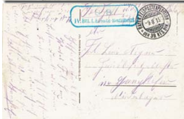
◀ C.P. photo éditée par J. MANIAS & Cie à STRASSBURG et expédiée le 9-8-1915 en franchise militaire.

"Die Feldgrauen teilen ihr Mittagessen mit armen Kindern (bei St. Kreuz)".