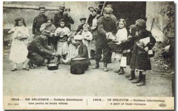
C.P. photo éditée en France. A voyagé en France (29-01-1915) ▲ Texte imprimé côté recto en français et en anglais : "1914... En Belgique – Soldats distribuant une partie de leurs vivres"

Pendant la période de la Grande Guerre, l'alimentation des enfants constitue une grande préoccupation pour tous. Et comme montré à la page précédente, dès le début des hostilités, de nombreuses cartes postales présentent des soldats français ou allemands qui partagent leurs repas avec des enfants démunis ou proches de leurs lieux de cantonnement.