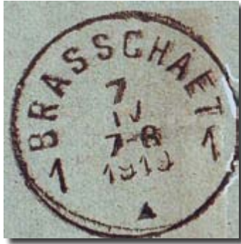
Lettre en franchise de “BRASSCHAET / 7 IV.1919 / 1 ▲ 1” (première date vue) avec cachet d'unité violet “CENTRE D'INSTRUCTION DES/ LIEUTENANTS AUXILIAIRES D'ARTILLERIE – ARMEE BELGE - / Commandant / du Groupe / des Batteries.” ▶