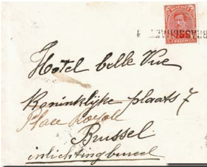
◀ Lettre de BRASSCHAET vers "BRUXELLES 15.1.1919"; port 10 centimes (1 ère classe de poids de 0 à 20 grammes : 10 centimes avec grand cachet nominatif "BRASSCHAET 1".