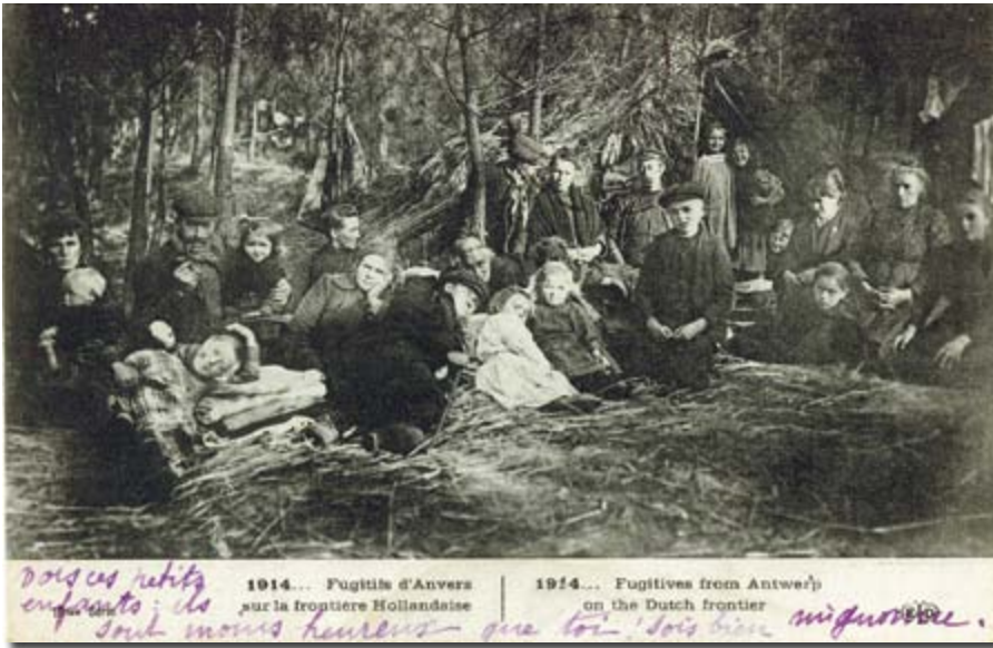
◀ C.P. photo éditée en France ; a circulé en Charente ; expédiée le 22-11-1914. 1914... Fugitifs d'Anvers sur la frontière hollandaise. Texte manuscrit rédigé côté recto par une maman à sa petite fille pour lui donner un conseil, façon bien particulière d'attirer son attention: "Vois ces petits enfants : ils sont moins heureux que toi ! Sois bien mignonne."

Les premières C.P. photographiques témoignent du malheur qui s'abat sur la population civile. Beaucoup de femmes, d'enfants et d'hommes qui ont dépassé l'âge de porter les armes se retrouvent sur les routes de l'exil...