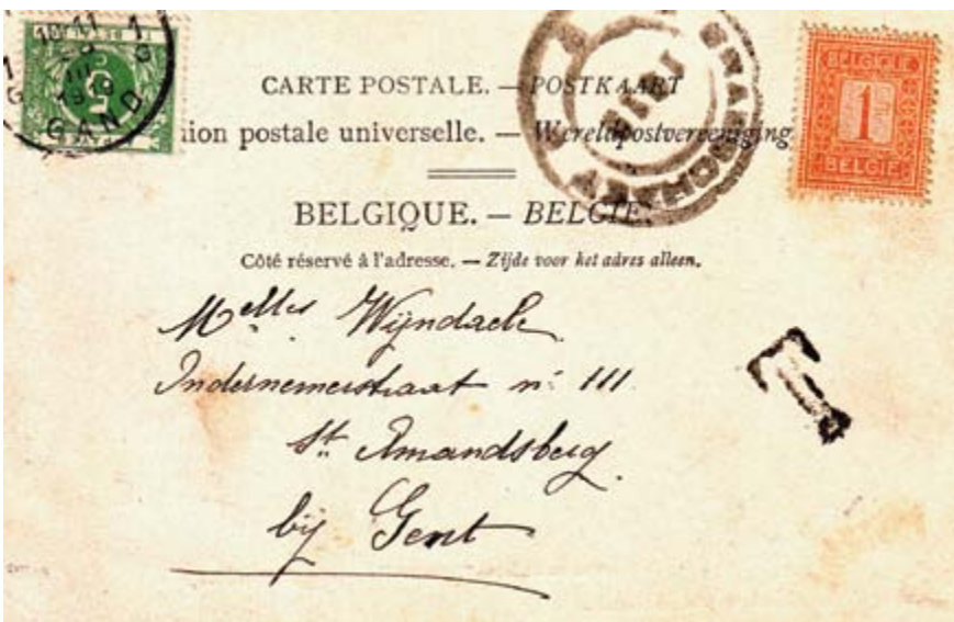
Carte vue avec timbre à 1 centime (N° 108 de 1912) qui a été mis hors cours le 15 octobre 1915, avec cachet double cercle en caoutchouc "BRASSCHAET / 1 ▼ 1 / 1919" vers GAND avec "T. A GAND, ajout d'un timbre-taxe de 5 centimes, double du port arrondi à 5 centimes "GENT 1 G / 28.III.1919 / GAND 1 G".

Il est probable que ces cachets en caoutchouc avec un triangle en bas et l'année 1919 au centre furent pour la plupart livrés entre février et juillet 1919, dans le but de doter les bureaux d'un cachet tandis que leurs propres cachets étaient envoyés à l'administration pour l'adaptation obligatoire (triangle).